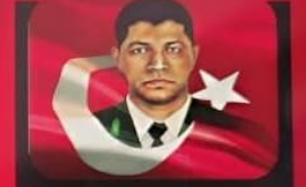
15 TEMMUZ ŞEHİDİ ÖMER HALİSDEMİR

Ey şehid ölümlü şehid, itene bendin malik, Sana göğün açtı deryayı Peygamber, Mehmet Akif Ersoy